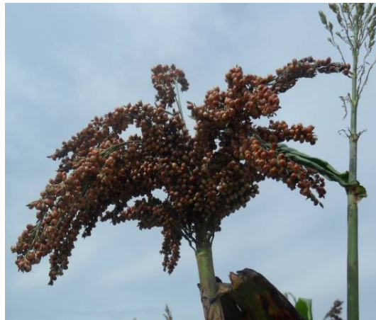
Panicule lâche en forme de « nid de tourterelle »

Quelques formes de panicules lâches de sorghos à grains sucrés