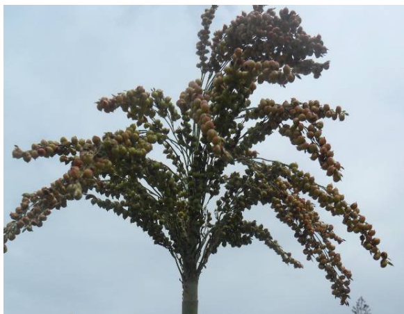
Panicule lâche en forme de « parapluie »

Cependant certains types de sorghos comme les sorghos à grains sucrés ne sont pas toujours très bien valorisés. Toutes les études antérieures sur la caractérisation des ressources génétiques des sorghos au Burkina Faso ont portées principalement sur les sorghos non sucrés (Zongo, 1991, Barro/Kondombo et al. , 2008, Barro/Kondombo, 2010) et les sorghos à tige sucrée (Nebié, 2014).