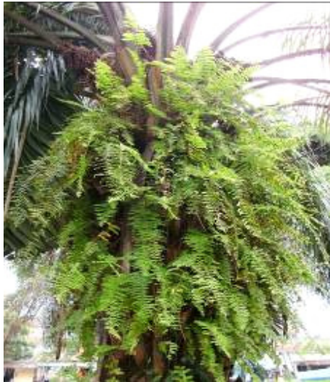
Figure 2 : Nephrolepis biserrata (Sw.) Schott. épiphyte.