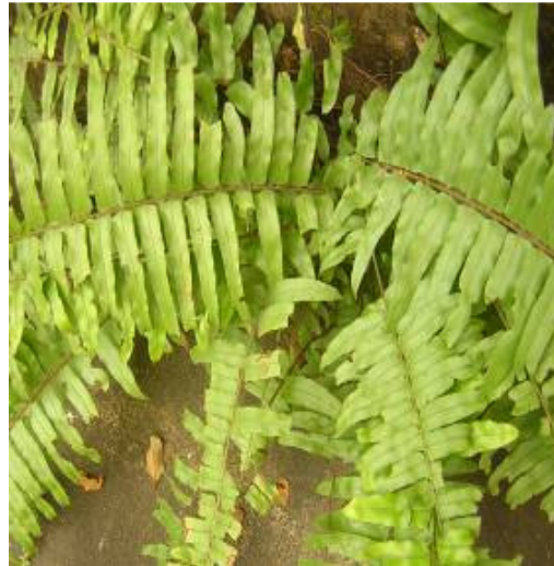
Figure 3 : Nephrolepis biserrata (Sw.) Schott. Terrestre