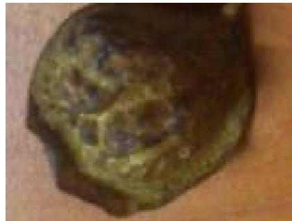
(B) Fruit morphotype 1