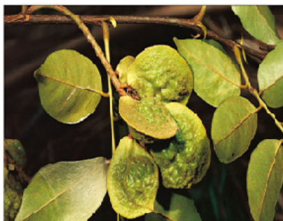
(A) Plante avec fruits

avril avec des graines turgescentes. 100 % des personnes interviewées affirment qu'il existe des arbres à fruits de petite taille (morphotype 1 ; Figure 1 ; photo A) et de grande taille (morphotype 2 ; photo B). Les observations de terrain faites ont confirmé ces connaissances endogènes. Les fruits à maturité sont de couleur beige ou brune claire et contenant 01 seule graine (morphotype 1) à 3 graines (morphotype 2). La pellicule des graines du morphotype 1 est de couleur rouge claire ; mais celle du morphotype 2 est de couleur orange claire (photo C). Les cotylédons sont de couleur beige.