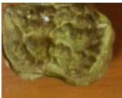
(C) fruit morphotype 2