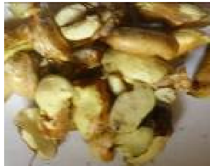
(D) Graines de P. santalinoides