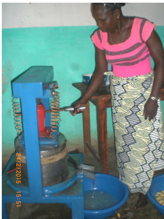
Presse hydraulique et son utilisation