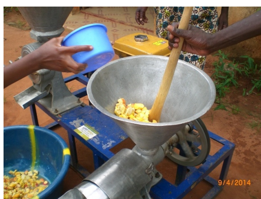
Broyeur du type Expeller