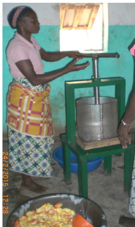
Presse à vis simple et son utilisation