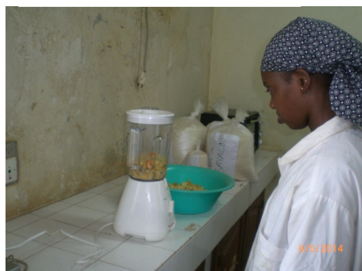
Mixeur « Moulinex »