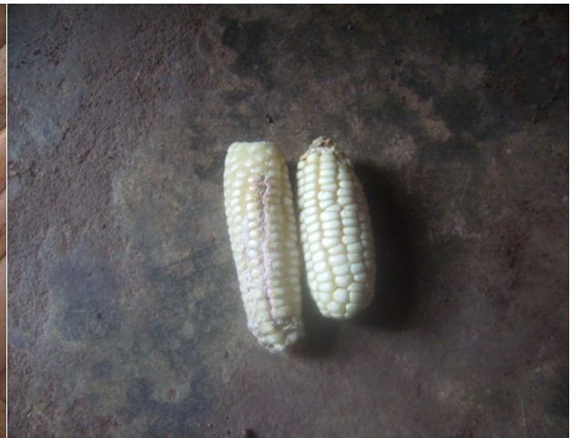
Photo 2 : Deux épis déspathés du cultivar Gbadé wéwé (novembre 2013)

Le cultivar « Gbadé wéwé » : Le cultivar Gbadé wéwé présente de petits épis ou des épis de moyenne taille, portant de petits grains blancs. Gbadé wéwé a un cycle de production plus long que celui de Gbadé vòvò. Sa récolte commence 3,5 mois après le semis. De ce fait, c'est une variété de maïs adaptée à la grande saison des pluies, soit de mi-mars à mi-juillet. Suivant les propos de certains enquêtés (80 %), lorsqu'elle est cultivée en petite saison des pluies, elle ne donne pas un rendement intéressant. Il faut souligner que sur l'échantillon étudié, 50 % des enquêtés ne cultivent pas cette variété signalent les difficultés de stockage et de conservation du cultivar Gbadé wéwé après les récoltes. C'est une variété de maïs très attaquée par les charançons. Cette réalité justifie le fait que 25 % des producteurs de maïs dans le village, ne donnent pas une bonne appréciation de ce cultivar. La photo 2 présente des épis du cultivar Gbadé wéwé.