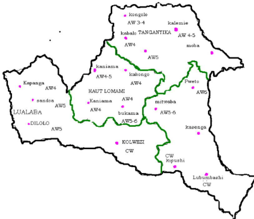
Figure 2. Détermination des différentes zones selon la classification Köppen. AW : climat tropical humide où la saison sèche se situe en hiver de l'hémisphère considéré et dont la hauteur pluviométrique du mois le plus sec descend en dessous de 60 mm ; CW : Climat tempéré chaud dont la saison sèche se situe en hiver de l'hémisphère considéré (KOPPEN).

Le sol de Kolwezi et ses environs présente des affleurements rocheux appartenant au soubassement cristallin précambrien (gneiss, granite et schiste) et aux sédiments (surtout sableux) du pléistocène. Ces sols ne sont pas riches malgré la luxuriance de la végétation qu'on attribue à une forte richesse en humus. Ceci est dû au fait que l'humus est rapidement détruit. (Anonyme, 2005). Quant à la végétation, celle-ci est en pleine régression. Certes, l'exploitation minière est souvent citée comme la principale cause de cette évolution régressive. Mais d'autres activités d'origine anthropique (agriculture itinérante sur brûlis, charbonnage, coupe de bois de chauffe ou d'œuvre, feux de brousse) contribuent dans une large mesure à l'amplification de cette régression. Cependant, Kikufi et Lukoki (2008) ont identifié 7 unités de végétation : (1) la pelouse métallicole, (2) les savanes steppiques et alluviales, (3) le bosquet arbustif à Uapaca robynsii De