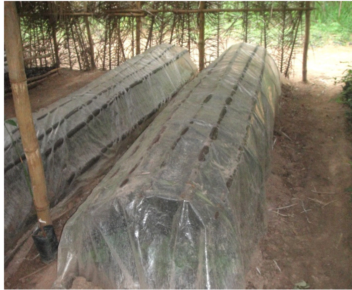
Figure 3. Tunnels de mise en culture des boutures de colatier

Caractères étudiés : Treize caractères ont servi à décrire les 56 accessions. Ces caractères sont le nombre d'étage foliaire (Efol), la longueur de la feuille (Lofe), la largeur de la feuille (Lafe), l'indice de surface foliaire ( Surf = Lofe * Lafe ), la longueur du pétiole (Lopet). La vigueur des plants a été étudiée à travers la hauteur (Haut) et le diamètre au collet (Diam), La hauteur et les dimensions de la feuilles ont été mesurées avec un mètre ruban et le diamètre avec un pied à coulisse. Les paramètres d'architecture ont été évalués à travers le port de l'arbre (Port) de l'arbre, le nombre de branches (Nbr), et la longueur des entrenœuds ( LoEN = Haut/Efol ). D'autres caractères ont été observés sur le pied mère au moment de la collecte des accessions. Ce sont : la couleur des noix majoritaires (CoNx), la couleur du tégument (CoTeg) et la forme des follicules (FormFr).