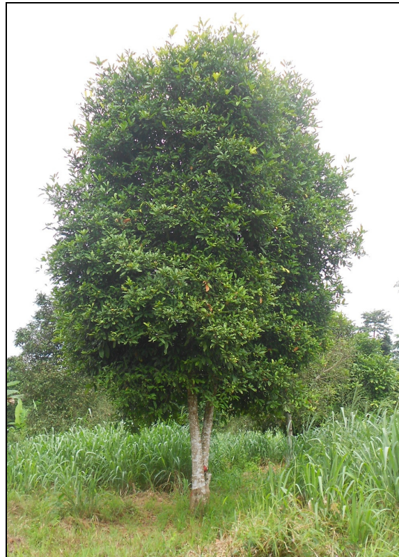
Figure 2. Photo d'un colatier ( Cola nitida )