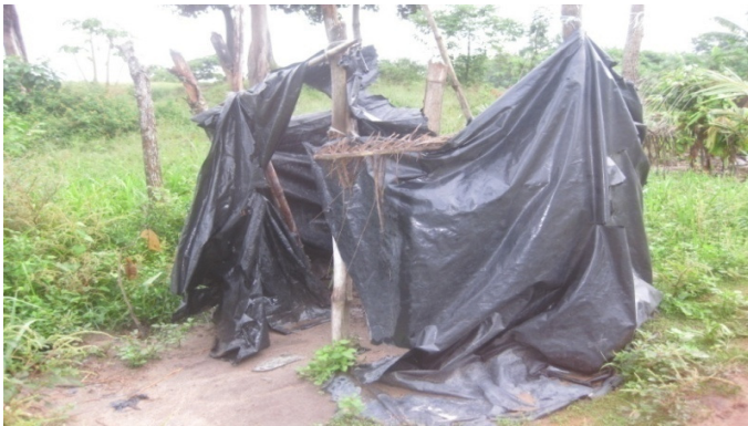
Fig. 3b: Enclos servant de douche et de latrine aux pêcheurs à Singrobo.