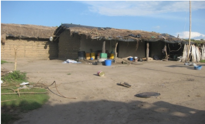
Fig. 3a: Habitation de pêcheurs construite à partir d'argile et de lamelle de palmier à Singrobo.