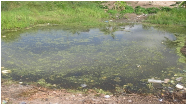
Fig. 4: Eau stagnante favorisant la prolifération d'anophèles femelles, agents vecteurs de paludisme à Singrobo.

Alphabétisation : Dans les localités visitées, la majorité des pêcheurs étrangers est analphabète (61 soit 56%) mais certains savent lire et écrire en arabe (48 soit 44%). Chez ces étrangers, la majorité des enfants en âge d'école ne sont pas scolarisés. Ces enfants sont le plus souvent utilisés pour la pêche en tant qu'aide du parent. Les filles des pêcheurs aident leurs mères dans les ménages au détriment de l'école.