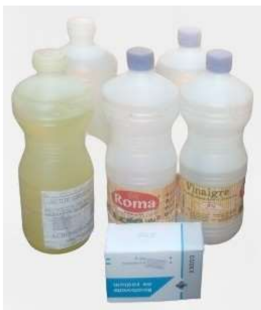
Fig.2. Dispositif de test au vinaigre d'alcool (bidon en fermeture bleu), Acide chlorhydrique (bidon en fermeture blanc) et le paquet de bicarbonate de sodium.

l'acide chlorhydrique à 32% d'acidité, le tarif est de 1500 francs CFA par litre (équivalent à 3 dollars américains). Un paquet de 250 grammes de bicarbonate de sodium blanc est disponible au prix de 2000 francs CFA (4 dollars américains). Ces dispositifs sont facilement accessibles financièrement pour les agriculteurs locaux.