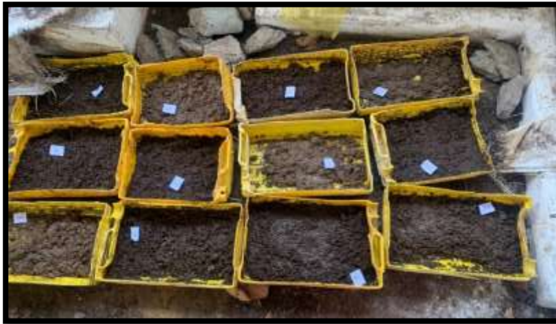
Photo 2 : Illustration du dispositif expérimental sur terrain

Pour chaque traitement, un kilogramme de substrat correspondant était déposé dans un bidon coupé de 25 ou 20 litres utilisé comme récipient tout en veillant pour S3 la mise de chaque substrat dans la proportion de 50% pour chacun, soit 0,5 kg de fiente de poule et 0,5 kg de lisier de porc. Une certaine quantité d'eau était mise dans chaque traitement pour humidifier le substrat en vue de garantir le bon environnement propice au développement des asticots. Une période de 18h allant du mardi 7 novembre à 13h au mercredi 8 novembre à 9h d'exposition de ces traitements à la ponte des mouches après avoir ajouté des mangues pourries pour l'attraction des mouches. La couverture de ces substrats exposés pour empêcher d'éventuelles pontes qui mettraient en mal l'homogénéité des asticots, utiles pour la récolte. Une période de quatre jours pour le développement des asticots jusqu'à la récolte. La récolte est intervenue le samedi 11 novembre, soit quatre jours après la couverture : cette dernière se faisait à l'aide d'un tamis avec des émailles de 3mm environ. Elle consistait à mettre à l'intérieur du tamis le substrat contenant les asticots tout en plaçant un récipient en bas qui va recueillir les asticots qui échappent par ces émailles puisqu'ils ont tendance à descendre dans le fond du substrat fuyant la lumière puisqu'ils sont lucifuges.