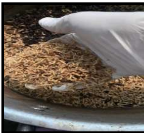
Photo 1 : Asticots obtenus pendant la récolte