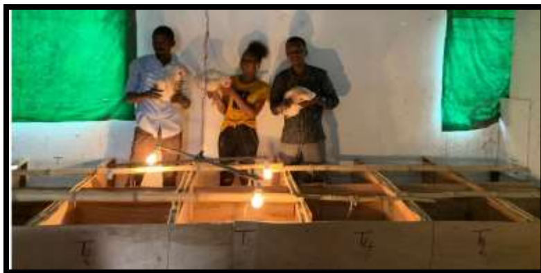
Photo 4 : Illustration du nourrissage des poulets de chair avec les différents aliments