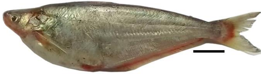
Figure 1: Schilbe grenfelli Boulenger, 1900 expérimenté ; Lt = 193,3 mm

Position systématique : Le mot « grenfelli » se réfère à la localité type où l'espèce a été identifiée pour la première fois dans la région de la ville de Boma dans la province du Kongo Central en RD Congo dans la partie inférieure du fleuve Congo (De Vos, 1995). D'après les informations rapportées par FishBase (2023), la position systématique de Schilbe grenfelli se présente comme suit :